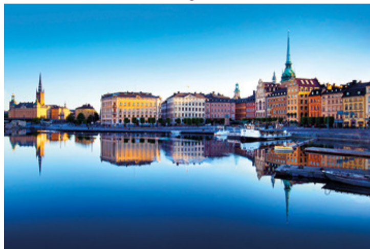
Stora Samhällsfastighetsdagen 📅 2025-01-30